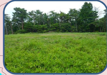
⑤自衛隊ヘリポート